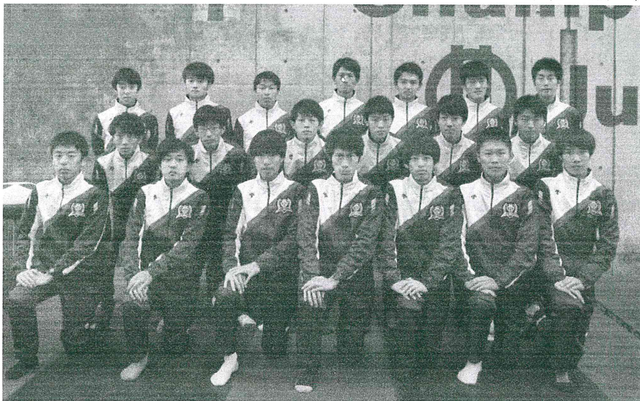
駅伝チームの選手達